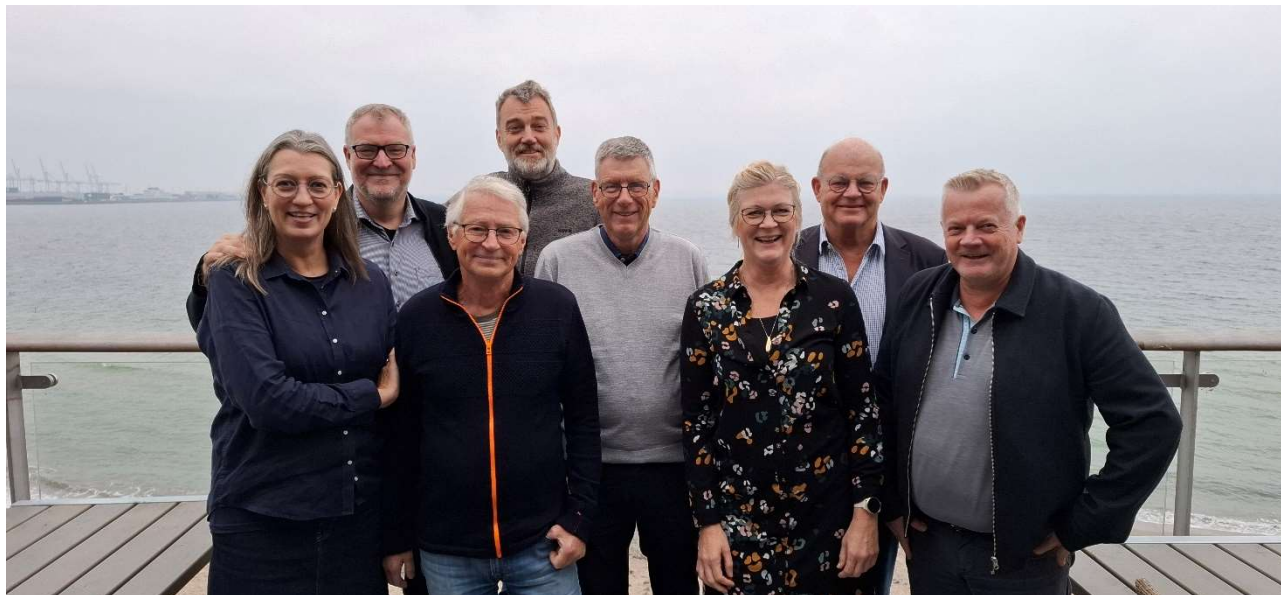
Bestyrelsen sæson 2024/25: