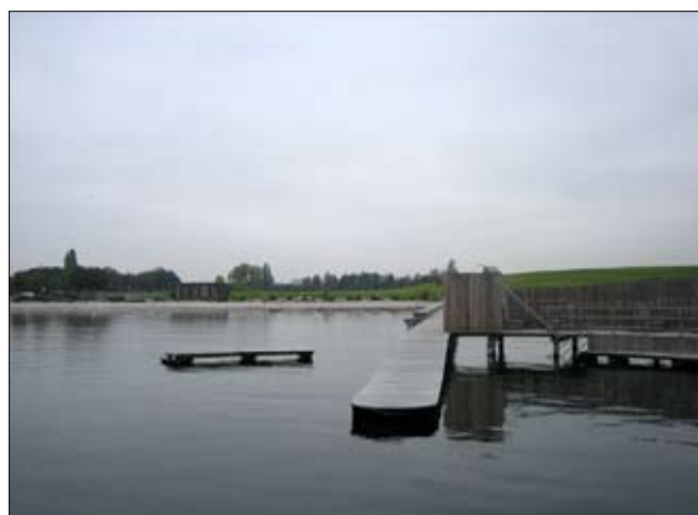
Et kig mod land. Bemærk den runde toiletbygning. Ikke hærværks-sikret nok!