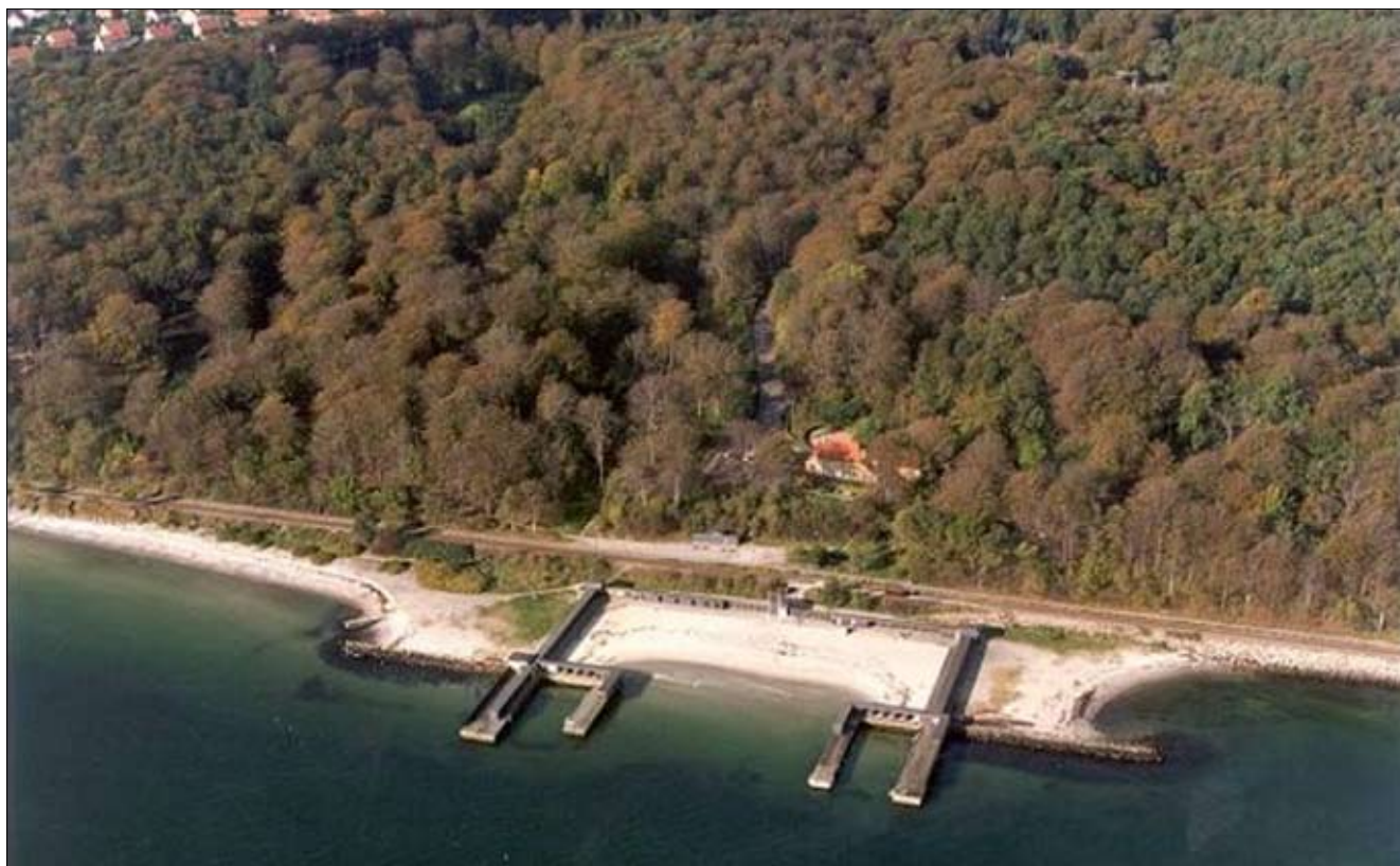
Anlægget som det stadig ser ud. Her ses anes den asymmetrisk placerede trappe op til P-pladsen ved Sjette Frederiks Kro

Århus Søbad hed badeanstalten tidligere, idet man benyttede det nu sjældent benyttede ord sø for hav, men navnet Den Permanente Badeanstalt, har været knyttet til stedet siden opførelsen i 1933. Badeanstalten blev anlagt neden for de stejle skrænter ved Sjette Frederiks Kro i Risskoven, på det sted, hvor der tidligere havde ligget en anlægsbro for Århusbugtens udflugtsbåde. Navnet Den Permanente skyldes at dette havbad i modsætning til de tidligere i Århus var opført på moler. Herved mindskede man de ødelæggelser, som hver vinter truer alle menneskeskabte anlæg langs kysten.