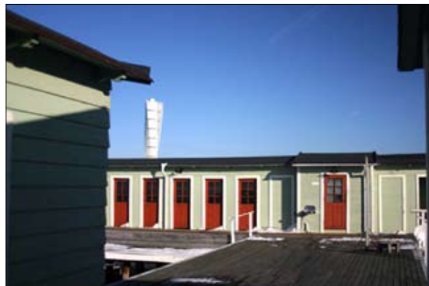
De lysegrønne og svenskrøde farver går igen overalt (i baggrunden Malmøs nye vartegn, Turning Torso)

den, der bl.a. kendes fra Den Permanente Badeanstalt i Århus, med en række omklædningskabiner, både lukkede og åbne. Vinterbadning spiller en vigtig rolle.