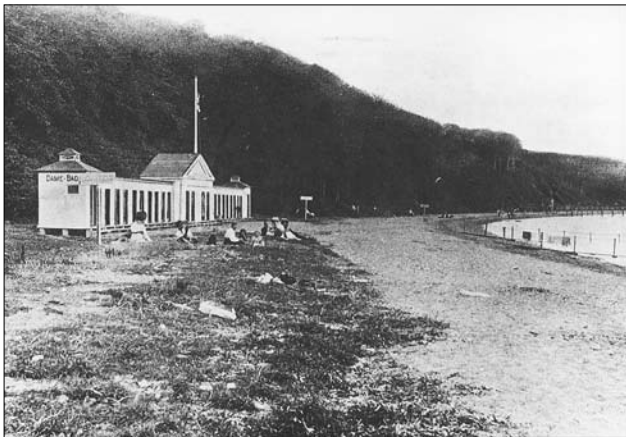
Badeanstalten Trouville fra 1910 var en umiddelbar forløber for Ballehage Søbad. Foto o. 1920 i Lokalthistorisk Samling

Syd for byen blev der også opført en række havbade. Først og fremmest den kommunale Søndre Badeanstalt ved Strandvejen ud for Marienlund. Den svarede til den Nordre Badeanstalt og blev på samme måde benyttet til skolesvømning. Der lå også et par andre, private badeanstalter ud for Strandvejen, bygget over samme koncept. Kort før Første Verdenskrig, blev der opført to badeanstalter på stranden ud for Dyrehaven, den nordligste del af Moesgaardskovene. Den store herregård var overtaget af Århus Kommune i 1898 og nu var der mulighed for at opfylde borgernes ønsker om at komme ud til skov og strand.