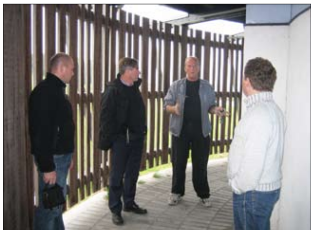
Den daglige leder fortæller om store hærværksproblemer