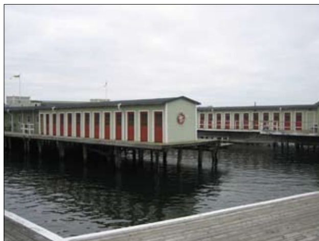
Et velholdt anlæg