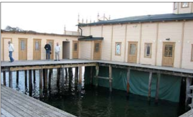
Et af de små lukkede bassiner hvor der er god plads til vandstands-stigning...hvad der ifølge de lokale brugere dog ikke er naturligt behov for (ingen tidevandsproblemer)

I perioden 1994-1996 førte et beskæftigelsespro-