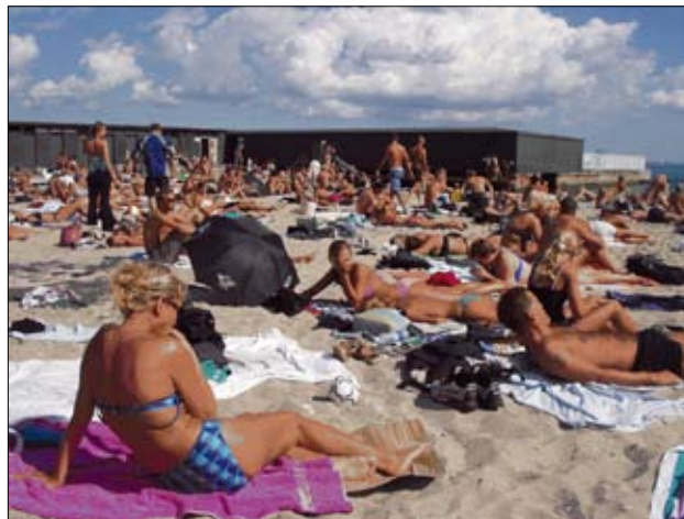
Fluepapir på den Permanente Badeanstalt i 2006.

De 2 havbadeanstalter har hermed fået et nyt og bredere perspektiv, og det bør efter Sport og Fritids opfattelse betyde en grundig overvejelse af den genopretningsindsats, der – jf. foran - allerede er besluttet.