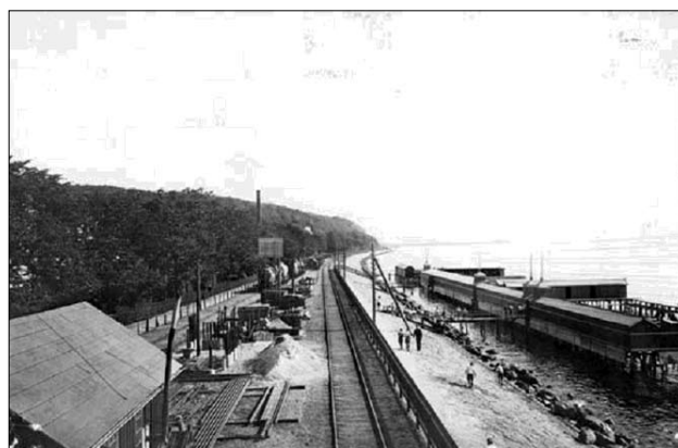
Nordre badeanstalt var placeret lige udenfor Østbanegården. Den stod på pæle og var opdelt i et herre og et dameafsnit. De mauriske tagryttere flankerede indgangene.

Nord for byen var der flere private badeanstalter, hvoraf de største var badeanstalten ved Riisskov fra 1873 og en badeanstalt ud for Riisskov Badehotel. Den dominerende var imidlertid den kommunale Nordre Badeanstalt. Den var opført i 1885 og lå ved stranden lige udenfor Østbanegården. Det var en et langstrakt bygningsværk udsmykket med mauriske tagryttere på hver side af indgangene. Den stod på pæle og var opdelt i et herre og et dameafsnit. Her havde skolerne deres svømmeundervisning, og udenfor skoletid blev den i sommerhalvåret benyttet som almindeligt havbad. Den Nordre badeanstalt blev voldsomt skadet ved en storm i 1929. Alligevel vedtog man samme år at genopbygge den, formentlig på grund af den funktion den udfyldte i idræts- og svømmeundervisningen. Også denne badeanstalt blev offer for havnens udvidelser og forsvandt i begyndelsen af 1950-erne.