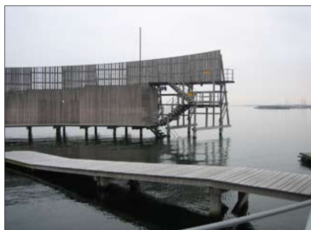
Handicaprampen bruges ifølge personalet meget sjældent. Men den er der