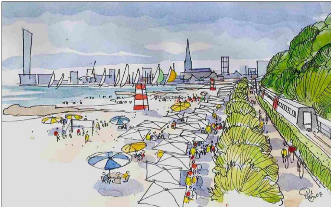
En ny badestrand langs Risskov -stien

Ikke mindst området syd for Den Permanente er et højt skattet værested, så snart solen skinner. Arealet tilhører formelt BaneDanmark, og skal det udnyttes i forbindelse med en udbygning af badeanstalten (det gælder både mod syd og nord), er Staten således "grundejer".