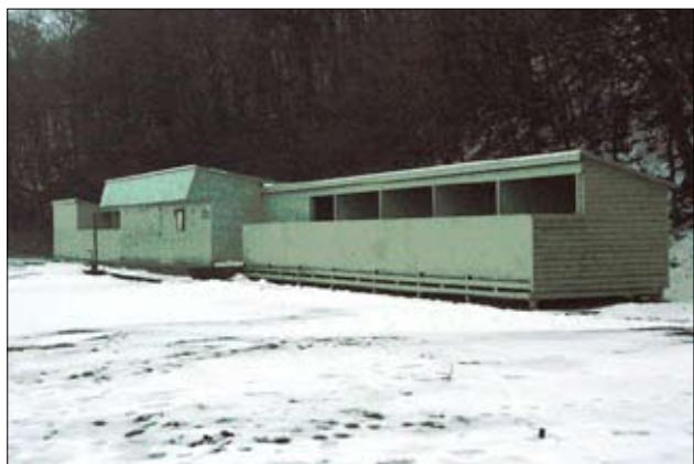
Havbadets bygninger set fra nord. Hovedindtrykket er en meget nedslidt bygning

I den rapport om Ballehage Havbad, som Ingeniørfirmaet Carl Bro i september 2003 udarbejdede for Århus kommune er der estimeret en række udgifter til vedligeholdelse og opretningsarbejde over en tiårs periode. Desværre er der i rapporten overhovedet ikke taget hensyn til de æstetiske forhold eller de ulemper som det nuværende anlæg har i den daglige brug. Der er i rapporten heller ikke givet bemærkninger om badeanlæggets udsatte beliggenhed ved stormfloder, og hvilke foranstaltninger dette burde medføre. Alene denne vinter har der været to sådanne episoder, hvor effekten af flere naturkræfter samles i et.