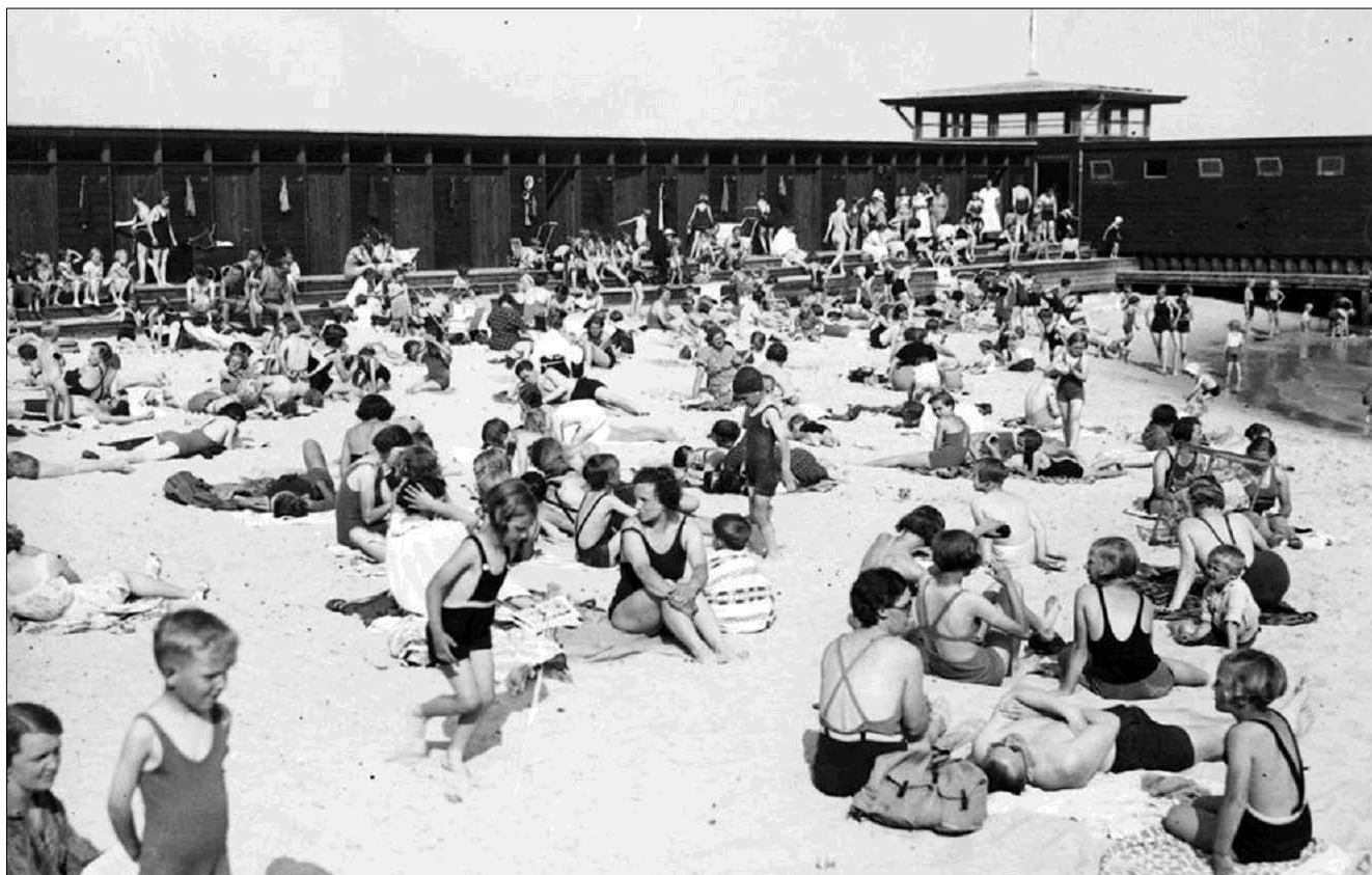
Fluepapir på Den Permanente Badeanstalts lukkede badestrand i 1940'erne.

nente, idet Århus kommune stiller Badeanstalten til rådighed for klubben i vinterhalvåret.