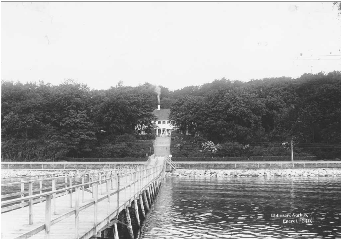
Sjette Frederiks Kro set fra badebroen ca. 1920 - en årrække før Den Permanente blev bygget i 1933

deriks Kro, et stort nyklassicistisk anlæg med fælles lukket badestrand, toiletter og separate dame og herreafdelinger. Den blev indviet i 1933 og hører til det bedste fra periodens byggeri i Århus og fungerer stadig efter det oprindelige koncept. På trods af forebyggende foranstaltninger, skete der imidlertid store ødelæggelser på anlægget ved er