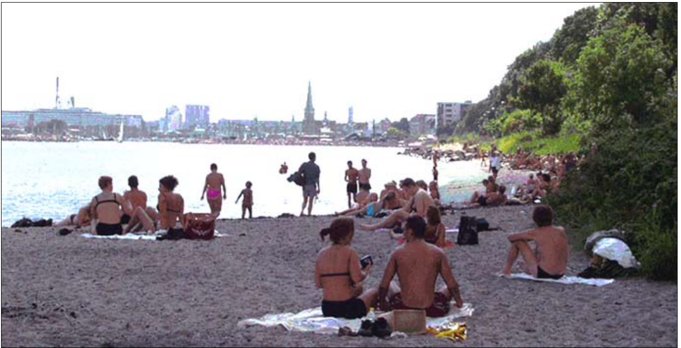
Vue fra stranden syd for Den Permanente mod byen. Nærheden til de kommende byudviklingsarealer på havnen er enestående og repræsenterer et væsentligt rekreativt potentiale. Der er under 1 km fra badeanstalten til bådhavnen og Langeliniebyggeriet.