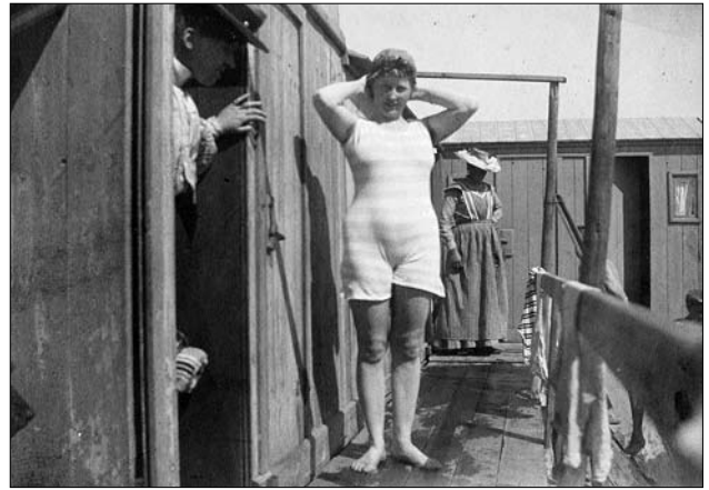
Omklædning på Søndre Badeanstalt

havbad lå nedenfor Varna. Desværre eksisterer ingen af dem mere. Trouville blev nedlagt i 1943 og Varnas Havbad i 1950. Forinden var Ballehage Havbad imidlertid opført i 1929. Det fungerer stadig og er senest udbygget i 1979. Det har ikke de samme æstetiske kvaliteter og trænger voldsomt til en opretning, men det er stadig rammen om to vinterbadeklubber og et stort antal badegæster i sommermånederne.