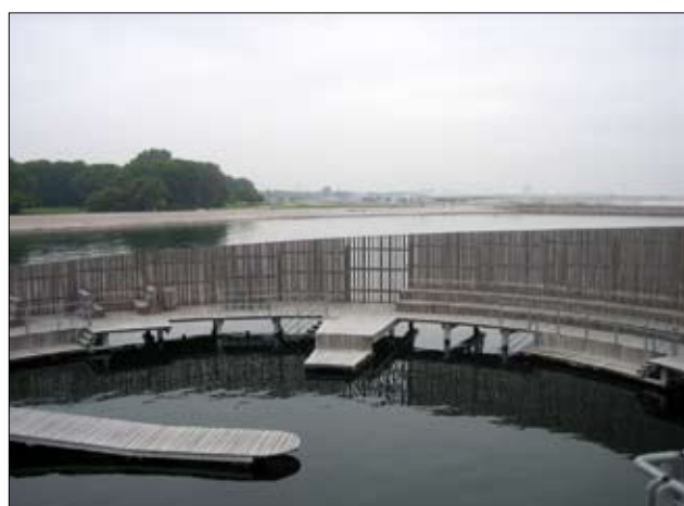
Masser af sidde- og "legemuligheder". I baggrunden Amager Strandpark der er opført af Københavns kommune. Samlet er der tale om et imponerende badeanlæg for Storkøbenhavns befolkning