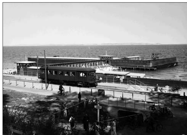
Grenåbanen standsede også tidligere ved Den Permanente. Foto i Lokalhistorisk samling

ligere fandtes i Århus. I det historiske afsnit er der af denne anlægstype bl.a. omtalt både den Nordre og den Søndre Badeanstalt, der også blev benyttet til den kommunale skolesvømning. Den Permanente er den sidste danske badeanstalt af denne type og alene af den grund af stor bevaringsmæssig og arkitektonisk interesse. Det nærmeste tilsva-