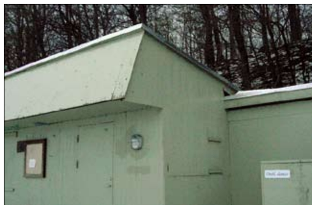
De interimistiske udskiftninger af facadens oprindelige bræddebeklædning

De fire bygninger på stranden er opført uden arkitektonisk sammenhæng. Materialer, bygningsformer og farveholdning varierer væsentligt fra bygning til bygning. Det eneste fælles og formildende træk er, at alle klubhusene trykker sig og skjuler sig ved skrænterne under løvskovens im-