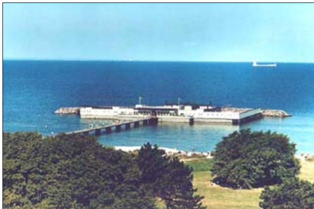
Ribersborg – "Ribban" – i sommerudgave

I 1993 ændrede Badet på ny status og blev igen en selvejende institution, der i øvrigt blev fredet i 2001.