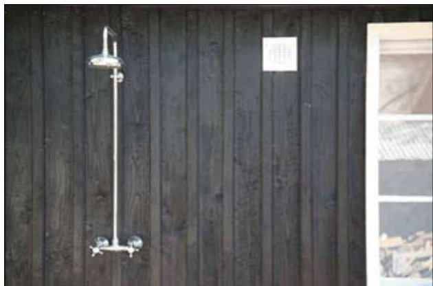
Det enkle koncept med få installationer er stadig gældende for havbadene. Der er ikke behov for spabad her.

Ved rådmandsbeslutning er i maj 2006 afsat 200.000 kr. til gennemførelse af nødvendige analyse- og projekteringsarbejder samt efterfølgende licitation vedrørende genopretningsarbejder på Den Permanente – og tilsvarende 50.000 kr. til Ballehage.