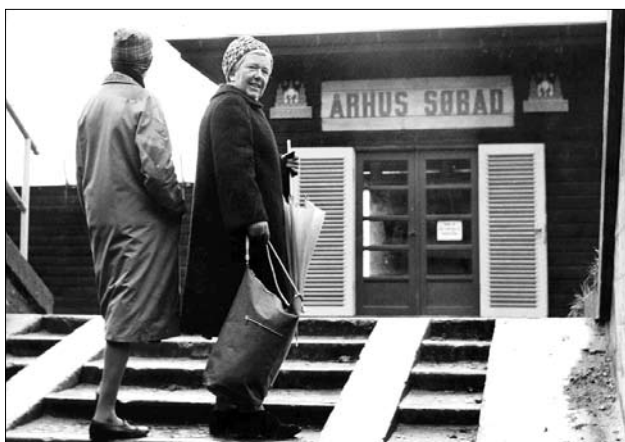
Frem til 1965, hvor en vinterstorm var tæt på at udslette den sidste del af "Århus Søbad" (Den Permanente), foregik adgangen gennem den centrale pavillon. Den anvendes i dag til depotformål

I sin arkitektur er Den Permanente enkel og markant. Den beskyttede strand er omgivet af halvtagsbygninger med omklædningskabiner, som danner en U-formet bygningskrop med en central indgangspavillon og fire hjørnepavilloner, der med lidt større volumen og højde end de tilstødende halvtagsbygninger understreger anlæggets hjørner og derved markerer badeanstaltens udstrækning. Hvor halvtagsbygningerne støder til hjørnepavillonerne i strandkanten, forgrener både den nordre og den søndre halvtagsbygning sig i endnu en U-formet bygningskrop, som er opført på betonstøbte moler og omslutter hvert sit bassin, der på samme måde som stranden er omgivet af halvtagsbygninger med omklædningsnicher.