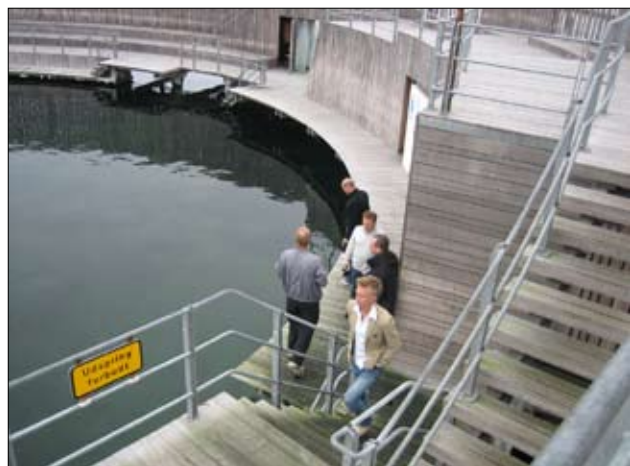
Udspring er forbudt – uden for sæsonen!