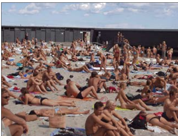
Den Permanente er både inden- og uden for murene" en stor århusiansk sommerattraktion

Arbejdsgruppen skal varmt anbefale, at det seriøst overvejes at etablere et nyt badestrandsforløb fra Den Permanente mod syd ind mod Langelinie/bådehavnen/de nye havneudviklingsarealer.