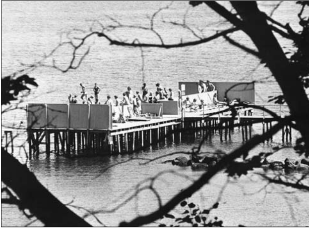
Ballehage med badeplatform - set fra stranden 1968.

ponerende bladhang. Men det samlede billede er et uplanlagt Klondyke, som i visse sammenhænge kan være ganske charmerende. Der kunne med tiden ønskes en fælles materialeholdning og farvevalg, hvor de sorttjærede bræddeskure med paptage kunne være et udmærket og maritimt udgangspunkt.