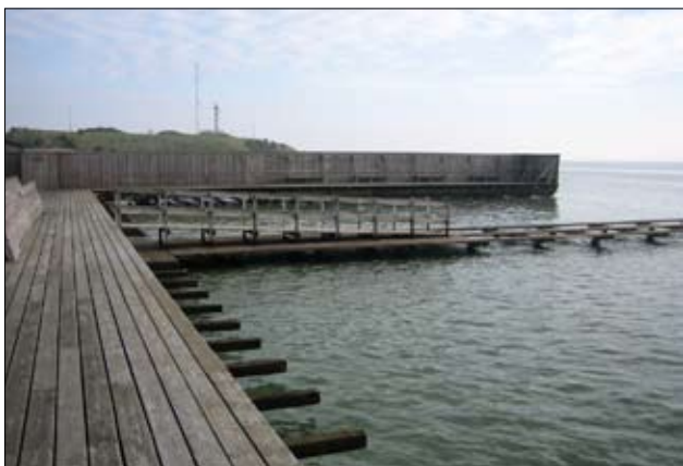
Et rigtig havbad med broer direkte mod det åbne hav. Men også med "lukkede" bassiner.

Badet er traditionelt opbygget med dame- og herreafdeling – og temmelig slidt. Vinterbadeklubben har ca. 300 medlemmer, der selv har opført en sauna og selv står for den løbende vedligeholdelse af den. Generelt er det klubben, der fører tilsyn med badet uden for sommersæsonen mod kommunal betaling af el, vand og varme. Det fungerer. Alle synes tilfredse. Princippet om "noget-for-noget" kendes godt fra Århus, hvor vinterbadeklubberne på samme måde leverer ydelser i et samarbejde med kommunen.