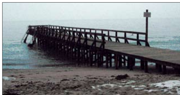
Den nuværende korte badebro med underdimensioneret stolpeværk