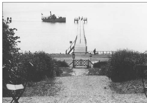
Badebroen ud for Sjette Frederiks Kro set fra kroen, ca. 1920