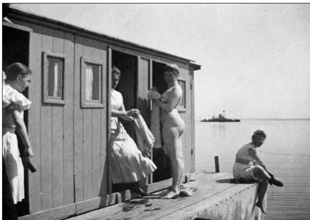
Badenymfer på Søndre Badeanstalt

Især havbadet Trouville udmærkede sig. Den lå nedenfor Ørnereden og var et herligt nybarokt anlæg med tempelgavl over midtpartiet og hjørnepavilloner som afslutning på en smal bygning med omklædningskabiner. Det andet tilsvarende