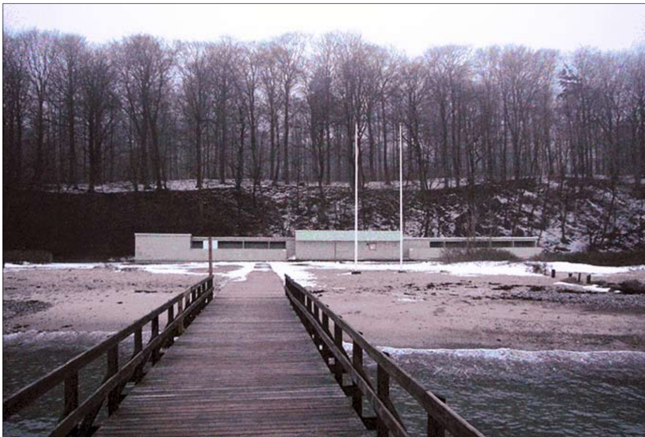
Ballehage Havbad set fra den nuværende badebro, der ikke ligger i anlæggets akse

Ballehage ligger på stranden nedenfor skrænterne i Dyrehaven, den nordligste del af Moesgaardskovene, godt en kilometer syd for hotellerne Marselis og Varna. Adgangen sker fra Ørneredevej hvor der er trapper ned til stranden fra to parkeringspladser. Ved den første parkeringsplads umiddelbart ud for Ballehage er der skønsmæssigt plads til 15 biler og ved den anden og noget større, der ligger i forbindelse med Silistrias gamle mølleanlæg, er der omkring 40 parkeringspladser. Den offentlige transport kan også benyttes hvis man skal besøge badeanlægget, idet linje 19 har holdeplads ved den ene parkeringsplads, ganske tæt ved trapper til stranden.