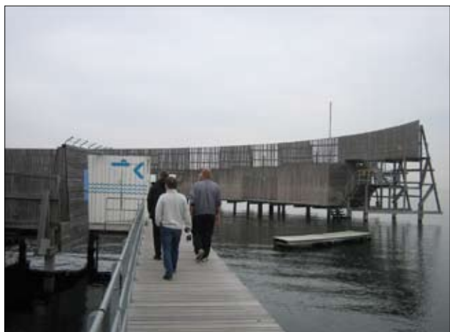
Adgangsbroen mod badindgangen. Bemærk pigtråden på toppen